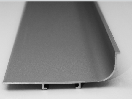
Perfil Gola "J"

Perfil de aluminio anodizado para aperturas de puertas y frentes de cajón.